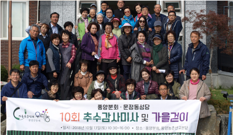
문정동성당 10회 추수감사미사 및 가을걷이