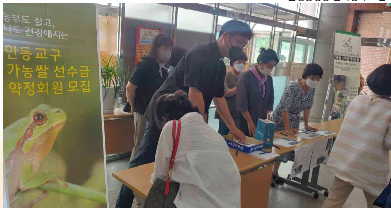
문정동성당 쌀약정자 모집

풍양지역은 농지가 넓고 일조량이 많아 양질의 쌀이 생산되는 곳으로 전국에 유명하다. 회원들은 친환경 쌀농사를 주로 하고 있다. 또한 친환경 전문 도정공장을 운영하며 서울, 대구, 부산 등의 대도시로 학교 급식 쌀을 공급하고 있다. 예천군 학교급식지원센터를 운영하고 있다.